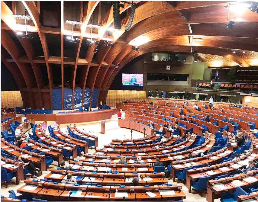
Zgromadzenie Parlamentarne Rady Europy