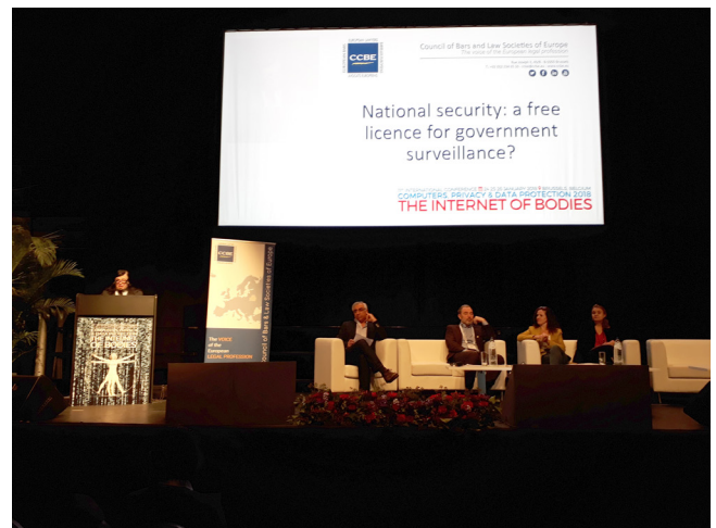
Iain Mitchell QC otwiera panel CCBE podczas konferencji.